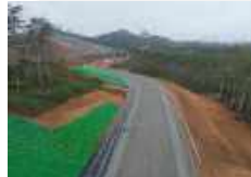
ROW 36 C