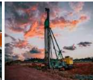
Pekerjaan Deep Soil Mixing