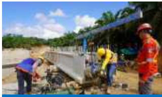
Jembatan Jalan Inspeksi (PCI Girder)