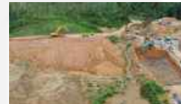
Kolam Retensi SG-01