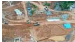
Kolam Retensi TR-01