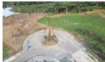
SCULPTURE PUNCAK BENDUNGAN