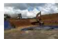
Galian Embung Bentayan