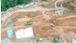
Kolam Retensi TR-01