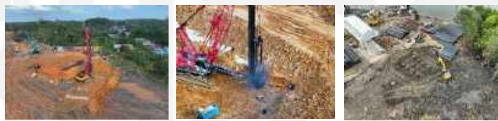
Pekerjaan Bore Pile