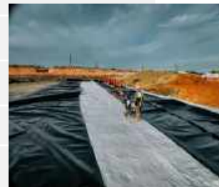
Pekerjaan Geotekstif & Geomembran