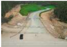
Jalan Akses Titik 0