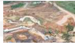
Kolam Retensi SG-01