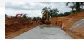
Cor LC Spillway & Conduit Bandara VVIP