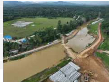
Area Pemancangan Hulu Intake