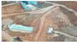
Kolam Retensi TR-01